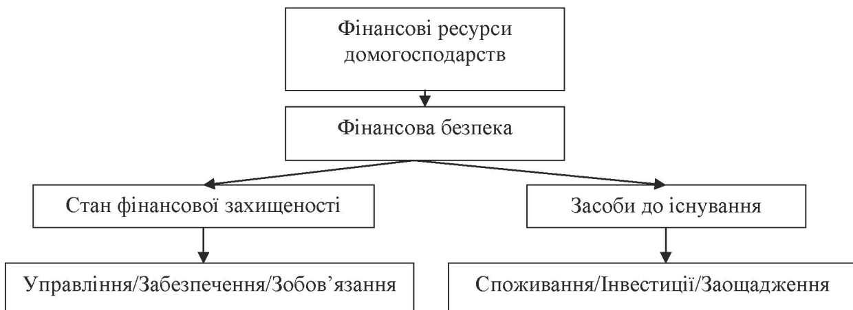
Рис. 3. Засади формування фінансової безпеки домогосподарств

Засадами для формування фінансової безпеки домогосподарств повинна бути система поглядів на те, яким має бути стан їх фінансової захищеності та якими засобами його можна забезпечити (рис. 3).