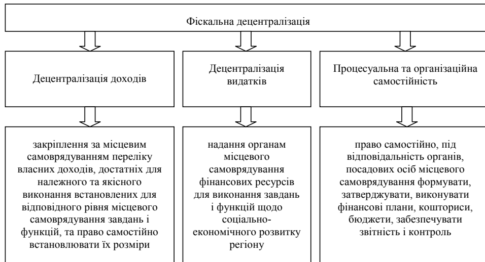
Рис. 1. Структура фіскальної децентралізації

Примітка. Складено автором за даними [4, с. 78].