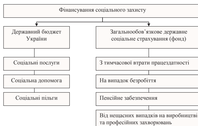
Рис. 1 Фінансування системи соціального захисту в Україні

Актуальність такого концептуального підходу сьогодні базується на зіставленні основних ресурсних чинників формування соціальних потреб розвинутих країн і України. Фінансування системи соціального захисту в Україні здійснюється з державного бюджету та фондів загальнообов'язкового державного соціального страхування (рис. 1).