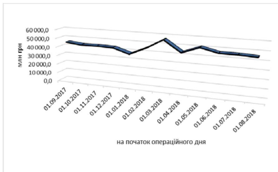
Ри. 2. Залишки на кореспондентських рахунках банків

Однак банківські установи продовжують достатньо обережно ставитися до активізації нарощування кредитування. Обсяги коштів на кореспондентських рахунках у банках, які останнє півріччя коливаються в межах 45–46 млрд гривень (рис. 2), також свідчать про наявність потенційних можливостей до кредитування.