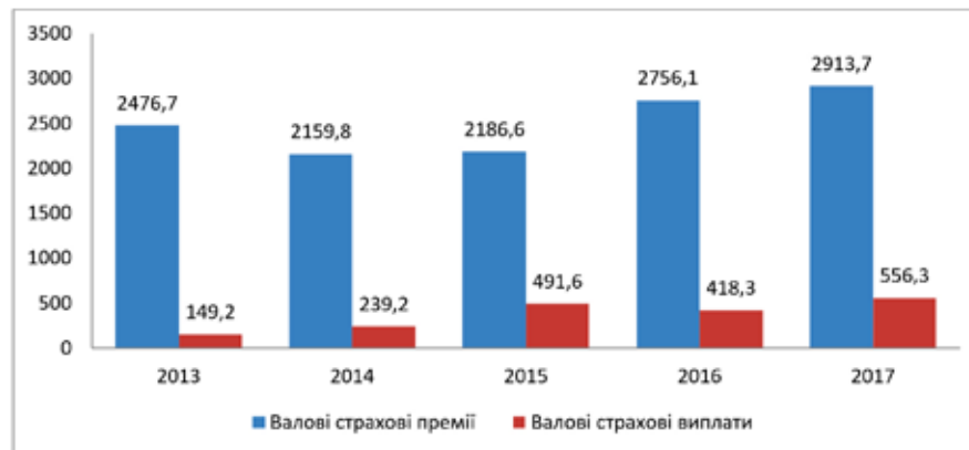
Рис. 2. Динаміка страхових премій та страхових виплат зі страхування життя впродовж 2013–2017 рр. (млн. грн.)

Доцільно проаналізувати основні показники зі страхування життя, зокрема динаміку страхових премій та страхових виплат за цим видом страхування впродовж 2013–2017 рр.