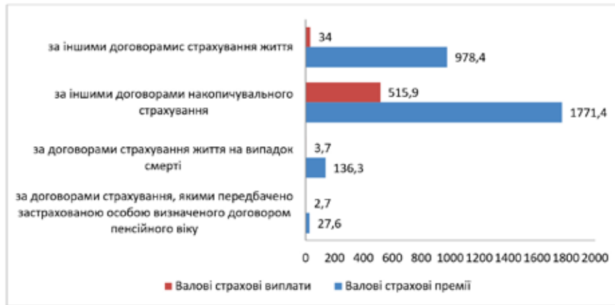
Рис. 3. Структура валових страхових премій та валових страхових виплат зі страхування життя станом на 31.12.2017 р.

Варто звернути увагу на структуру валових страхових премій та валових страхових виплат зі страхування життя, що зображено на рисунку 3.