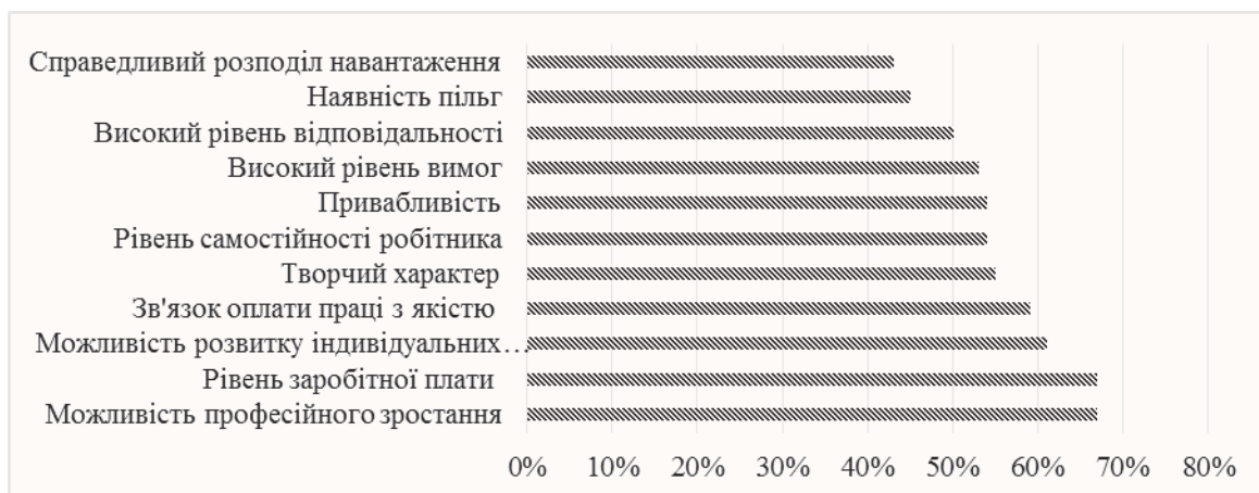
Рис. 1. Аналіз чинників мотивації персоналу на іноземних підприємствах [1, 2]

Підтвердженням того, що заробітна плата, як засіб мотивації персоналу в сучасних умовах, відіграє ключову та домінуючу роль, є дослідження чинників мотивації, проведені американськими вченими на промислових підприємствах. На підставі результатів досліджень, проведених із метою удосконалення методів мотивації персоналу, можна стверджувати, що цінність праці персоналу залежить від ряду чинників, де перше місце займають можливості професійного зростання і просування по службі, а також рівень заробітної плати працівника (рис. 1.).