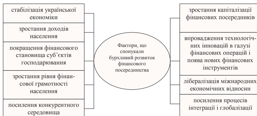
Рис. 1. Стимулюючі фактори розвитку українського інституту фінансового посередництва наприкінці ХХ – початку ХХІ століття

Найбільш активна стадія розвитку фінансового посередництва припала на кінець ХХ – початок ХХІ століття. На нашу думку, найбільш суттєвими факторами, що слугували в цей час поштовхом до розвитку українського інституту фінансового посередництва, були: стабілізація української економіки, підвищення доходів населення, покращення фінансового становища суб'єктів господарювання тощо (рис. 1).