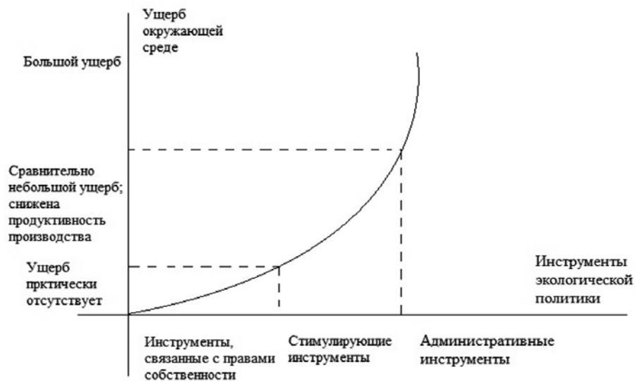
Рис. 2. Рациональное использование инструментов экологической политики

технологий, сырья и материалов. В то же время импорт природоёмкой и отходоёмкой продукции исключает ее производство в данной стране, уменьшая тем самым негативное производственное воздействие. Эти моменты необходимо учитывать при проведении внешнеэкономической и производственной политики в стране.