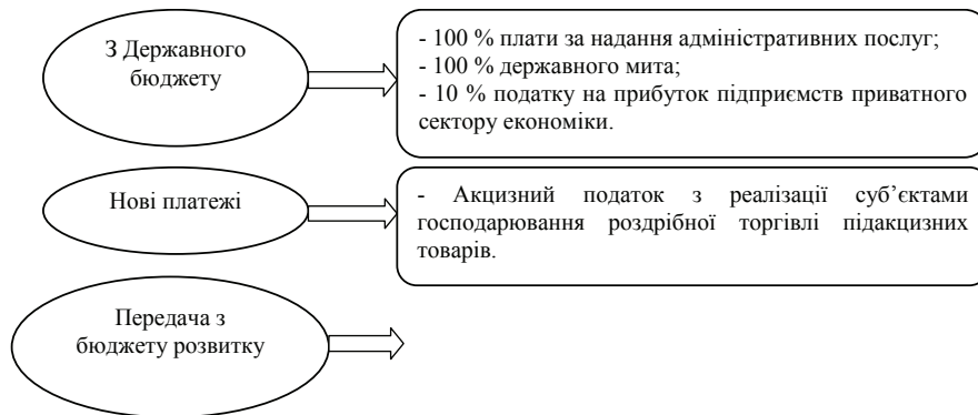
Рис. 1. Розширення доходів загального фонду місцевих бюджетів України у процесі бюджетної реформи 2015 року

Крім того, внаслідок податкових змін у 2014 році з 2015 року до місцевих податків і зборів віднесено податки на майно, зокрема плата за землю, що суттєво вплинуло на зміну структури доходів місцевих бюджетів. Так, за січень–вересень 2015 року питома вага місцевих податків з урахуванням податку на майно та єдиного податку у доходах місцевих бюджетів склала 22,4 % [7, с. 55].