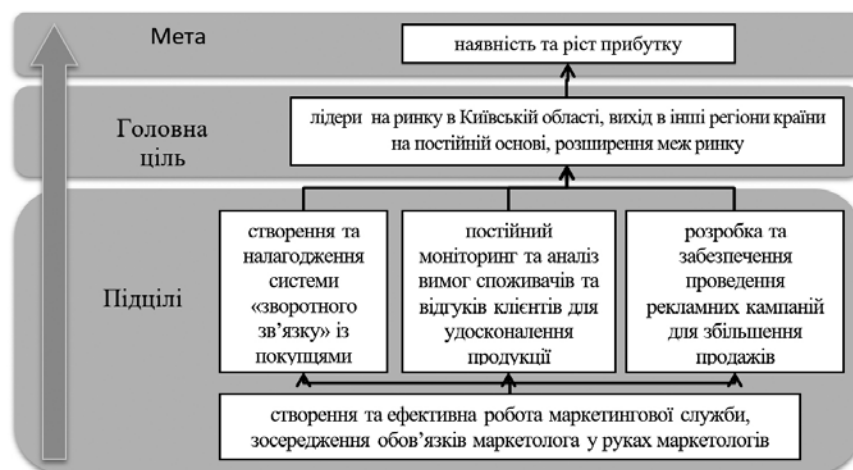
Рис. 4. «Дерево цілей» підприємства «Валькірія»

Коли «дерево проблем» побудоване, у підприємства є чітке уявлення того, на що необхідно направити свої зусилля. Для якісного формулювання варто здійснити перетворення негативних тверджень на позитивні, що в результаті визначить основні цілі діяльності підприємства для підвищення ефективності та конкурентоспроможності. Для повного бачення сформованих цілей нашим заключним етапом була побудова «дерева цілей», де на верхньому рівні знаходиться головна мета, у центрі – головна ціль (цілі), а на нижньому рівні – підцілі, завдання для досягнення цілей (рис. 4).