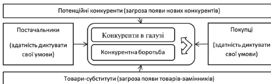
Рис. 1. Сили, які визначають галузеву конкуренцію [10]

Модель «5 сил М. Портера». Цей метод є ефективним для визначення найбільш детальної оцінки головних факторів та сили їх впливу на КС підприємства. Модель містить 5 головних факторів впливу (рис. 1).