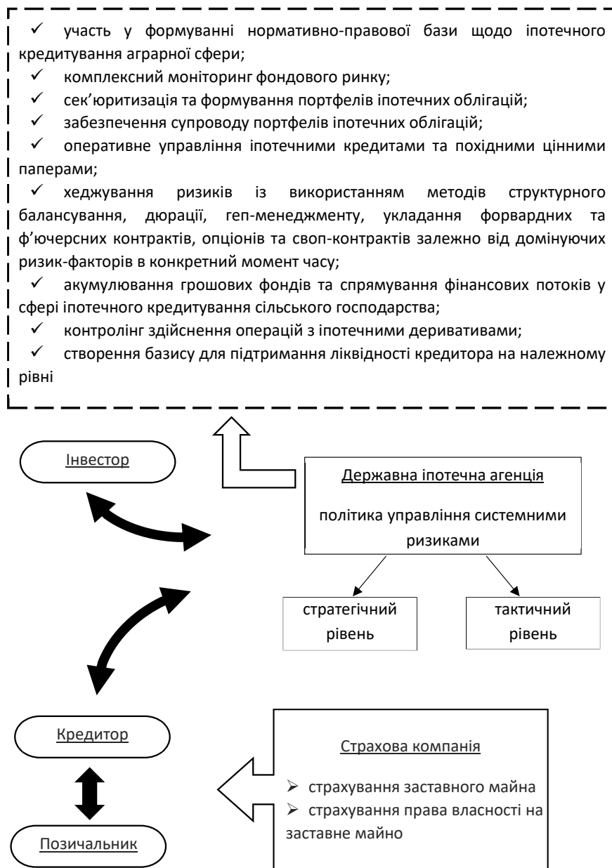
Рис. 3. Модель взаємодії інститутів управління ризиками в іпотечній системі

Під час формування та використання ресурсного потенціалу іпотечного кредитування у сфері інтересів інвестора існує ризик ліквідності іпотечних деривативів на вторинному фондовому ринку. Потреба у рефінансуванні кредитів спонукає кредитора виходити на ринок цінних паперів, забезпечених іпотечними кредитами. Емісія іпотечних облігацій пов'язана з виникненням ризиків, що у випадку емісії класичних облігацій лягають на кредитора, а в разі випуску облігацій з іпотечним покриттям ризик переходить до інвестора.