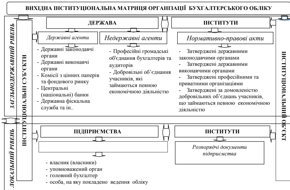
Рис. 2. Структура вихідної інституціональної матриці організації бухгалтерського обліку [14]