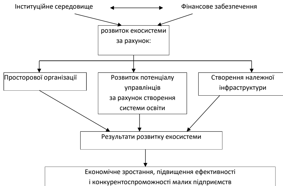
Рис. 1. Модель екосистеми діяльності малого підприємства (складено автором за даними [19; 20])

Багатогранність підприємництва як соціально-економічного явища допускає різні його трактування залежно від завдань дослідження і дозволяє взяти за вихідне таке визначення: підприємництво – це особливий базисний тип відтворення, що включає організаційну, новаторську і соціальну складові, які найбільш успішно можливо реалізувати в умовах органічного розвитку екосистеми діяльності підприємства. Модель такої екосистеми розроблена автором з опорою на роботи [19; 20] і наведена нижче (рис. 1).