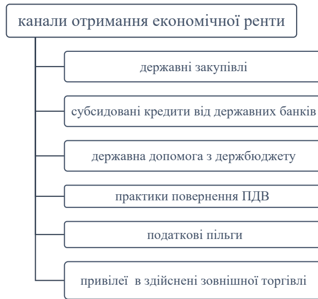
Рис. 1. Канали отримання економічної ренти в Україні

Домінування в тому чи іншому суспільстві однієї з альтернативних цінностей, їх взаємозв'язку впливає на господарський розвиток, і їх аналіз стає важливим інструментом прогнозування його провідних тенденцій [3].