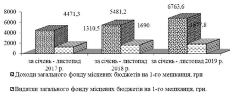
Рис. 2. Доходи загального фонду місцевих бюджетів на 1-го мешканця та видатки на 1-го мешканця за період січень–листопад 2017–2019 рр.

Показником, який дозволяє визначити рівень достатності бюджетного потенціалу ОТГ та наявно показує відповідать тенденції формування доходів місцевих бюджетів потреби формування фінансово незалежного місцевого самоврядування, є порівняння власних доходів загального фонду місцевих бюджетів на 1-го мешканця з показником видатків загального фонду на 1-го мешканця (рис. 2).