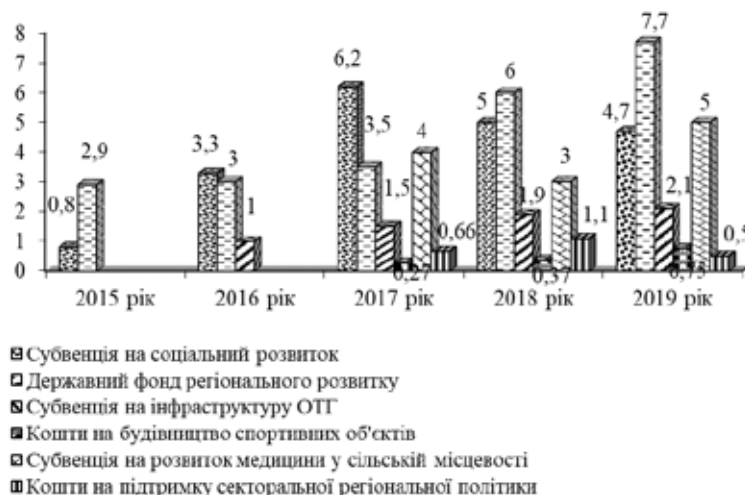
Рис. 3. Державна підтримка місцевого та регіонального розвитку за період 2015–2019 рр. (млрд грн)

У 41,5 рази 2019 р., порівняно з 2014 р., зросла державна підтримка місцевого та регіонального розвитку. Крім того, на 2019 р. передбачена субвенція на будівництво, реконструкцію, ремонт та утримання доріг загального користування місцевого значення в сумі 14,7 млрд грн [11]. Обсяги державної підтримки місцевого та регіонального розвитку за період 2015–2019 рр. наведено на рис. 3.