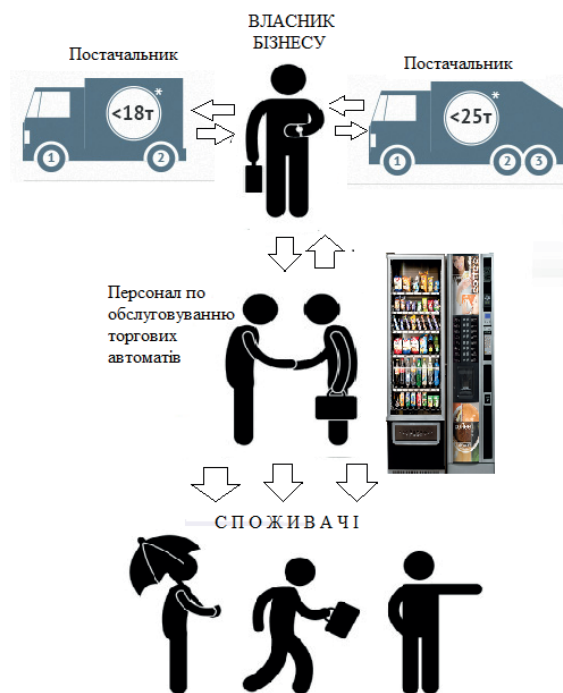
Рис. 1. Типова схема взаємовідносин між учасниками вендингового бізнесу [2, с. 15]