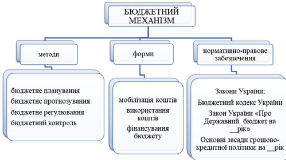
Рис. 1. Визначальні складові бюджетного механізму

випадку основна увага приділяється саме фонду фінансових ресурсів загальнодержавного значення, тобто державному бюджету. Розглянемо визначальні складові бюджетного механізму (рис. 1).