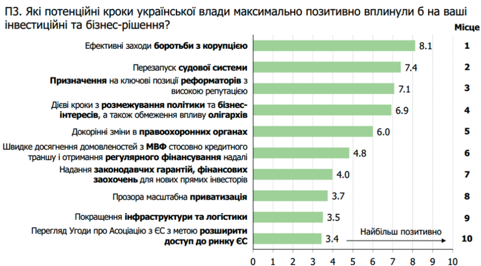
Рис. 4. Потенційні заходи, які можуть покращити інвестиційну привабливість України в 2020 р.

В цьому дослідженні опитувані інвестори розповіли про речі, які максимально позитивно вплинули б на інвестиційну привабливість (рис. 4) [8].