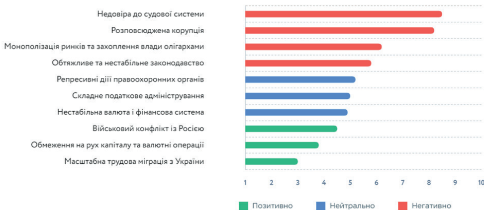
Рис. 3. Основні перешкоди для іноземних інвестицій в Україну в 2020 р.