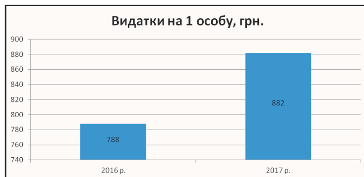
Рис. 1. Видатки бюджету розвитку ОТГ України на 1 особу у 2016–2017 рр.

За досліджуваний період видатки з бюджету ОТГ зросли на 95 грн, що у відсотковому відношенні становить 12% росту. Збільшення суми коштів, яку витрачали об'єднані територіальні громади на розвиток місцевих територій і закладів є позитивною тенденцією, адже це свідчить про збільшення відкритості й ефективності діяльності об'єднань. Причиною цього є зростання доходів ОТГ і зростання цінової політики у всіх секторах економіки країни.