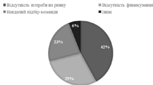
Рис. 3. Причини невдач серед стартапів, % [23]

Попри значну кількість стартапів, які з кожним роком збільшуються, існує низка проблем з їх подальшою реалізацією. Зокрема, майже 90% стартапів стають неуспішними через 3 ключові проблеми (рис. 3).