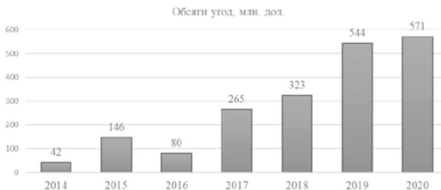
Рис. 1. Динаміка обсягів інвестицій у вітчизняні стартапи, млн. дол [10]

Зокрема, у 2021 році у даному заході прийняли участь представники з різних країн, де фіналісти були представлені з таких як Польща, Румунія, Греція, Кіпр, Хорватія, Італія, Іспанія, Угорщина, Ірландія, Україна та Бельгія, що презентували свої стартапи у 18 категоріях [12]. За категорією «Туризм» першість обійняв «Live Electric Tours», який також був переможцем «Найкращий стартап у світі» у категорії «Sustainability» у заході «Tourism Startup Competition», що організовувався ЮНВТО.