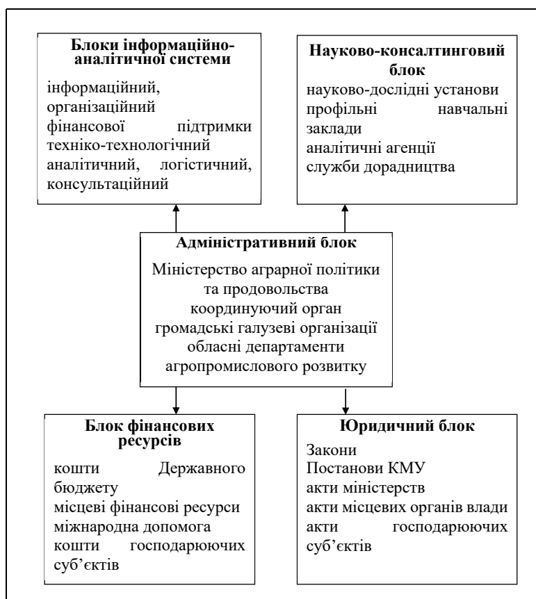
Рис. 2. Складові фінансово-організаційного механізму балансу харчових продуктів

Беручи до уваги розроблений теоретико-методологічний базис та підходи сформуємо фінансово-організаційний механізм цього балансу (рис. 2).