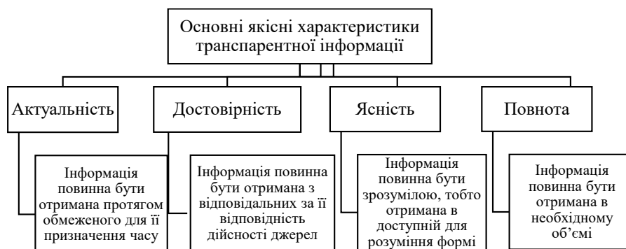
Рис. 2. Основні якісні характеристики прозорої інформації підприємства

Основні якісні характеристики прозорої інформації підприємства наведено на рис. 2. До них відносять актуальність, достовірність, ясність та повноту.