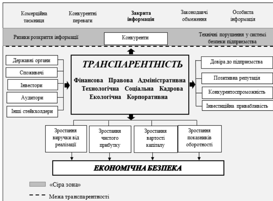
Рис. 4. Вплив транспарентності на діяльність підприємства на основі безпекоорієнтованого підходу

Відповідно до вищевказаного дослідження переваг та недоліків транспарентності варто зазначити, що транспарентність повинна мати встановлені межі. Ці межі повинні перш за все визначати об'єм інформації, яка є необхідною для підвищення репутації підприємства та водночас яка задовольнила б інтереси всіх зацікавлених учасників та не несла б загрози економічній безпеці підприємства. Крім того, між такими межами транспарентності існує так звана «сіра зона», у якій існують ризики розкриття інформації для конкурентів, наприклад, шляхом комерційного шпionажу або недоліків системи безпеки підприємства (рис. 4.).