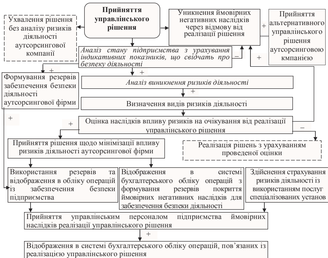
Рис. 3. Порядок управління ймовірними наслідками реалізації управлінських рішень, які здійснюються в умовах ризику діяльності аутсорсингової компанії

Охарактеризувавши суть, позитивні та негативні моменти використання методів управління ризиками діяльності аутсорсингових компаній, окреслено й обґрунтовано способи оптимізації ризиків, а також управління наслідками реалізації діяльності їх (рис. 3).