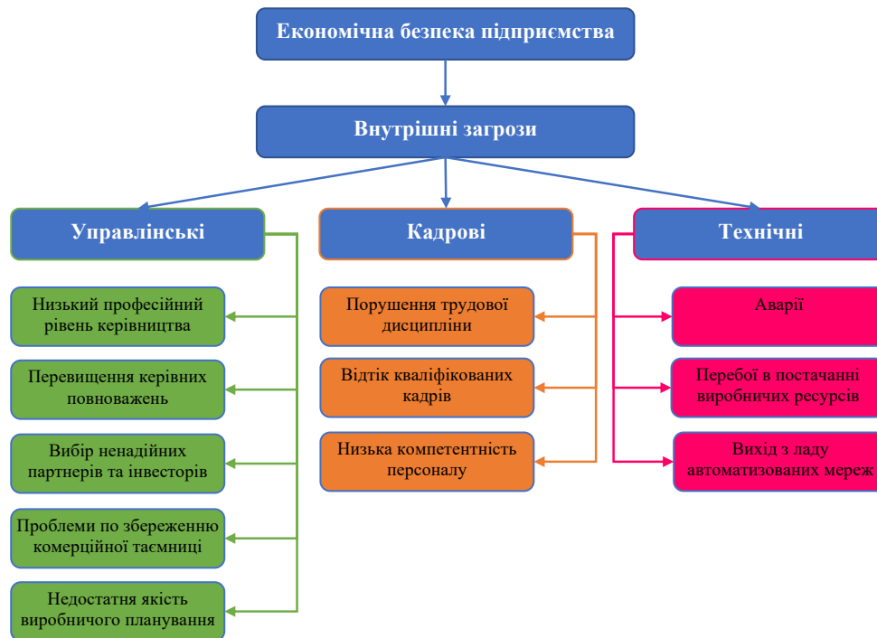
Рис. 1. Класифікація ендогенних факторів економічної безпеки суб'єктів господарювання

факторів економічної безпеки суб'єктів господарювання варто згрупувати їх за типовим характером впливу (рис. 1).