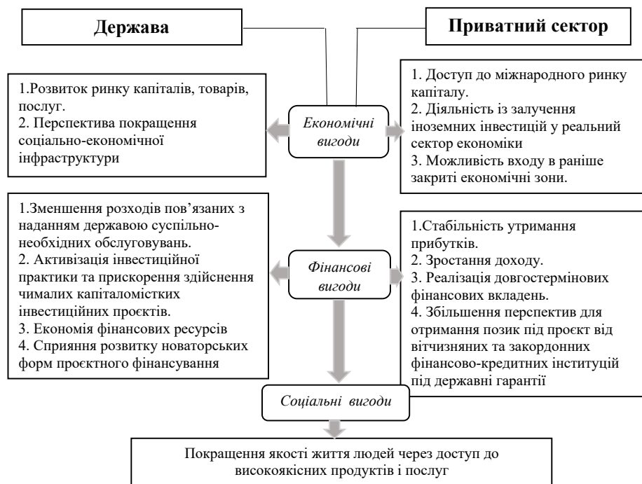
Рис. 1. Економічні, фінансові та соціальні вигоди учасників державно-приватного партнерства

Що стосується особливостей державно-приватного партнерства, то вони охоплюють характер фінансових відносин, характер розподілу ризиків і результатів діяльності, а також перелік учасників партнерства. Незважаючи на існуючі труднощі становлення державно-приватного партнерства, згадане партнерство відіграє істотну роль в модернізації підприємств та української економіки. Враховуючи стан інфраструктури України, участь приватного сектору в реалізації проєктів у сфері економіки є дуже актуальною. Однак державно-приватне партнерство у нашій країні функціонує в умовах недосконалого правового середовища, недовіри держави до приватного сектору, політичної нестабільності та корупції, що не стимулює участь приватних партнерів до фінансової допомоги галузей господарства України.