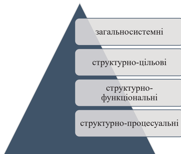
Рис. 1. Класифікація видів державного управління

Щодо класифікації видів принципів державного управління, їх поділяють на: