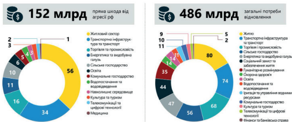
Рис. 3. Звіт про потреби відновлення України станом на 1 січня 2024 р., млрд дол. США

Згідно з рис. 3, найбільшої шкоди зазнали такі галузі, як житловий сектор, транспортна інфраструктура, промисловість, енергетика та сільське господарство. Ці 5 сфер економіки отримали 75 % загальної прямої шкоди від агресії росії. Ті ж самі галузі потребують найбільшої допомоги.