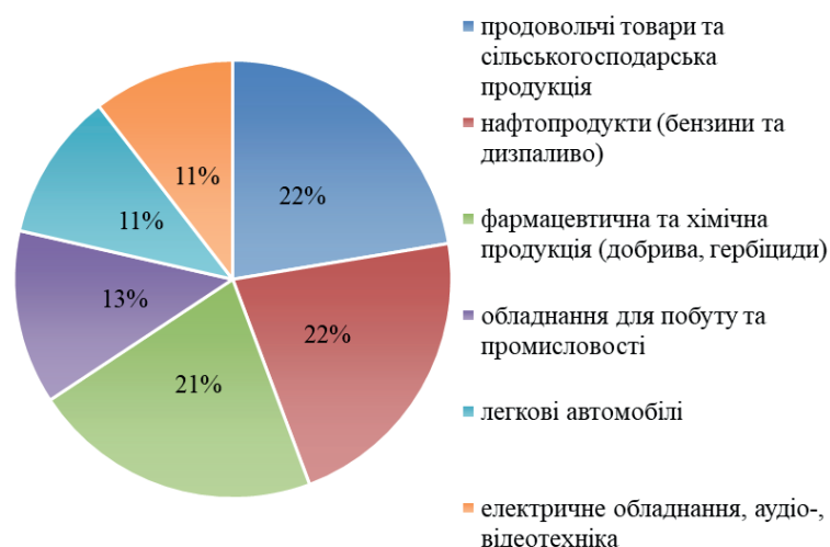
Рис. 2. Товарна структура митних надходжень до державного бюджету України у лютому 2023 р.

У лютому 2023 р. спостерігалось зменшення обсягів податкових надходжень до бюджету, що обумовлено об'єктивними факторами. Серед них важливими є: