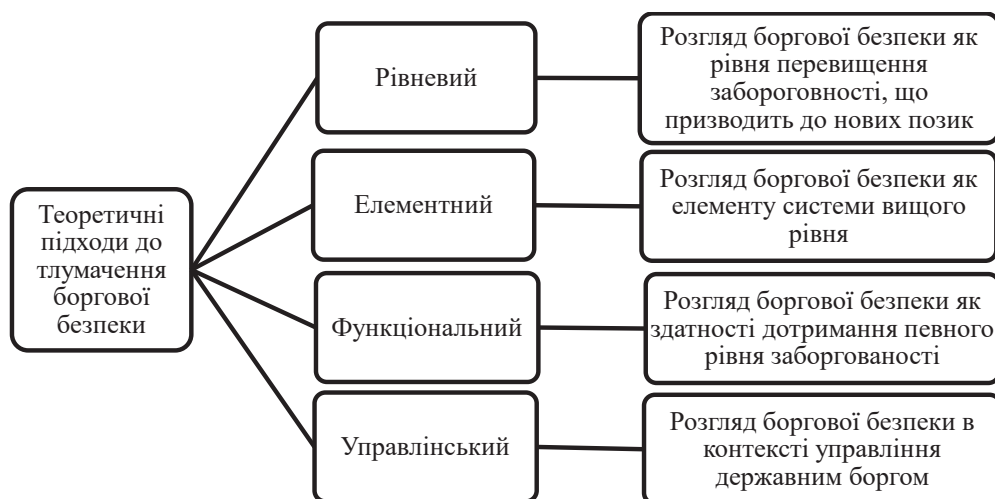
Рис. 1. Підходи до тлумачення поняття «боргова безпека»

Для зменшення обсягів та негативних наслідків боргового навантаження Україна повинна впроваджувати раціональну боргову політику. Це включає в себе оптимізацію структури державних запозичень, зменшення дефіциту державного бюджету, покращення управління державним боргом та нарощування боргової безпеки. При розкритті сутності поняття «боргова безпека» нами було виокремлено такі підходи (рис. 1):