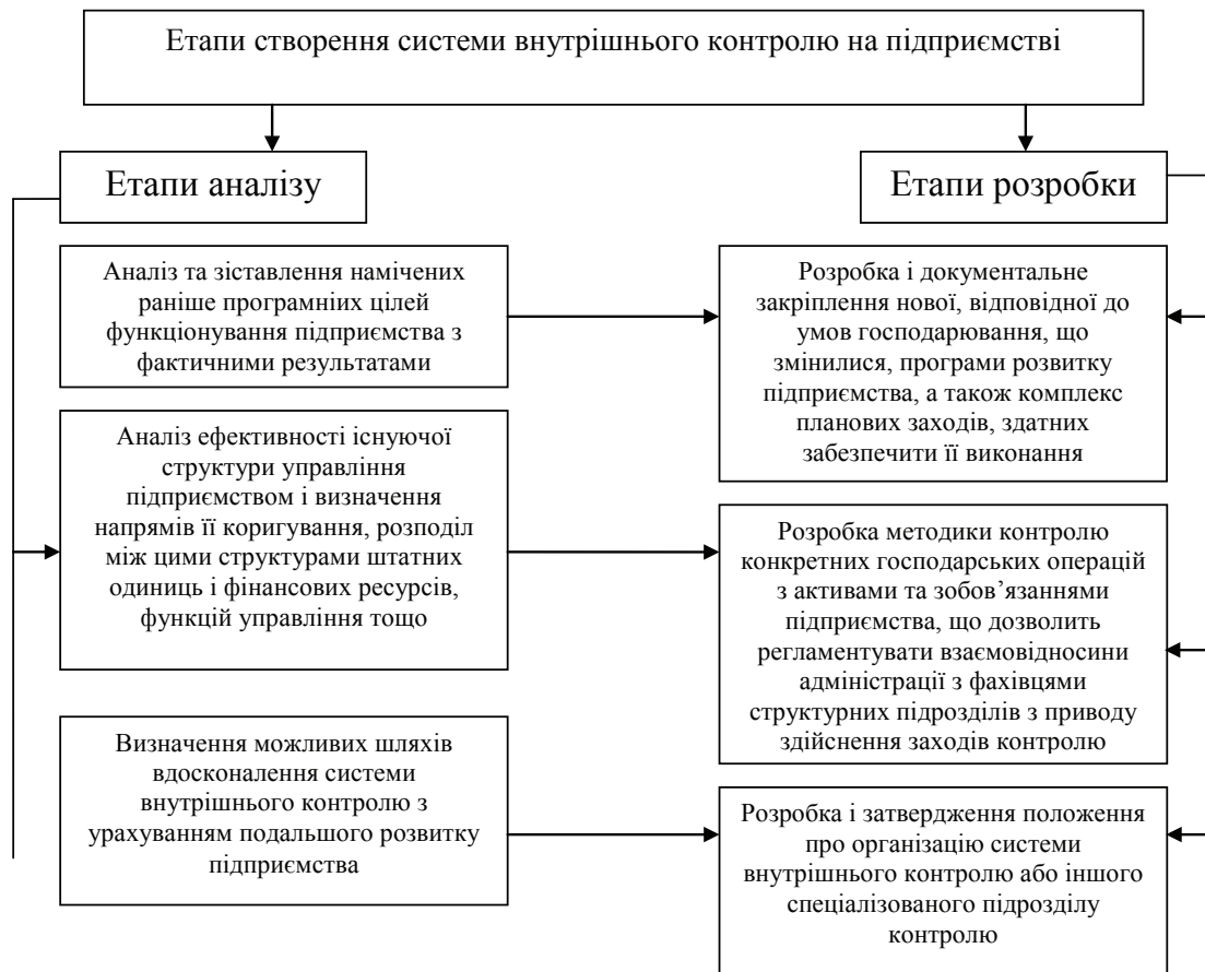
Рис. 2. Процес створення системи внутрішнього контролю на підприємстві*

* Узагальнено автором на основі джерел: [1; 3]