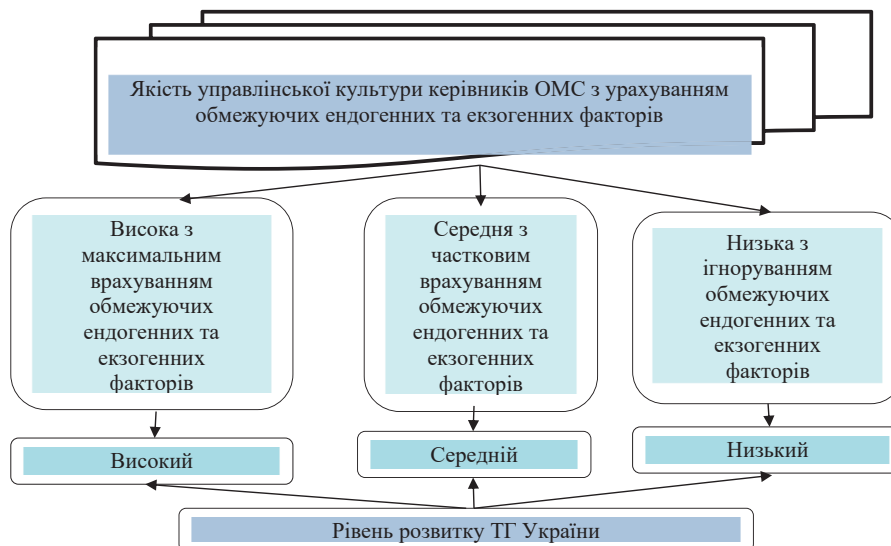
Рис. 3. Взаємозв'язок між рівнем розвитку ТГ та якістю управлінської культури керівників ОМС з урахуванням обмежуючих ендогенних та екзогенних факторів

Проаналізуємо діяльність ТГ України. Так, станом на 1 червня 2024 р. в Україні функціонувало 1469 територіальних громад [2; 8]. А відтак, за їхній розвиток, зокрема економічний, відповідало 1469 керівників або їх заступників, які виконували посадові обов'язки відсутніх керівників. Закономірно, що рівень розвитку окремої територіальної громади залежить від її ресурсного потенціалу, зокрема частки активних підприємств, які забезпечують зайнятість населення, високу заробітну плату, надходження до місцевого бюджету за рахунок податків і платежів.