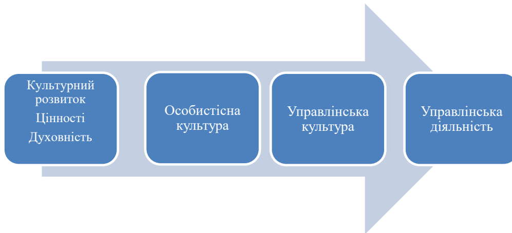
Рис. 1. Модель формування успішної управлінської діяльності керівників ОМС