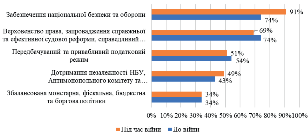
Рис. 2. Топ-5 основних перешкод для інвесторів, за опитуванням компаній США у 2023 р.

З метою наочного порівняння ситуації до початку війни та в умовах її ведення доцільно виокремити п'ять основних бар'єрів для іноземних інвесторів за результатами опитувань Агентства США з міжнародного розвитку, Міністерства торгівлі США та Американської торгової палати в Україні (рис. 2).