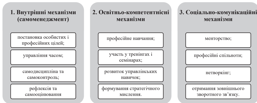
Рис. 1. Ключові складові механізму управління розвитком лідерських якостей самозайнятих осіб

З огляду на відсутність формалізованої системи управління персоналом, розвиток лідерських якостей самозайнятих осіб ґрунтується на поєднанні внутрішніх механізмів самоменеджменту, освітньо-компетентнісних інструментів та соціально-комунікаційної підтримки. Сукупність цих складових формує механізм управління розвитком лідерських якостей самозайнятих осіб (рис. 1).