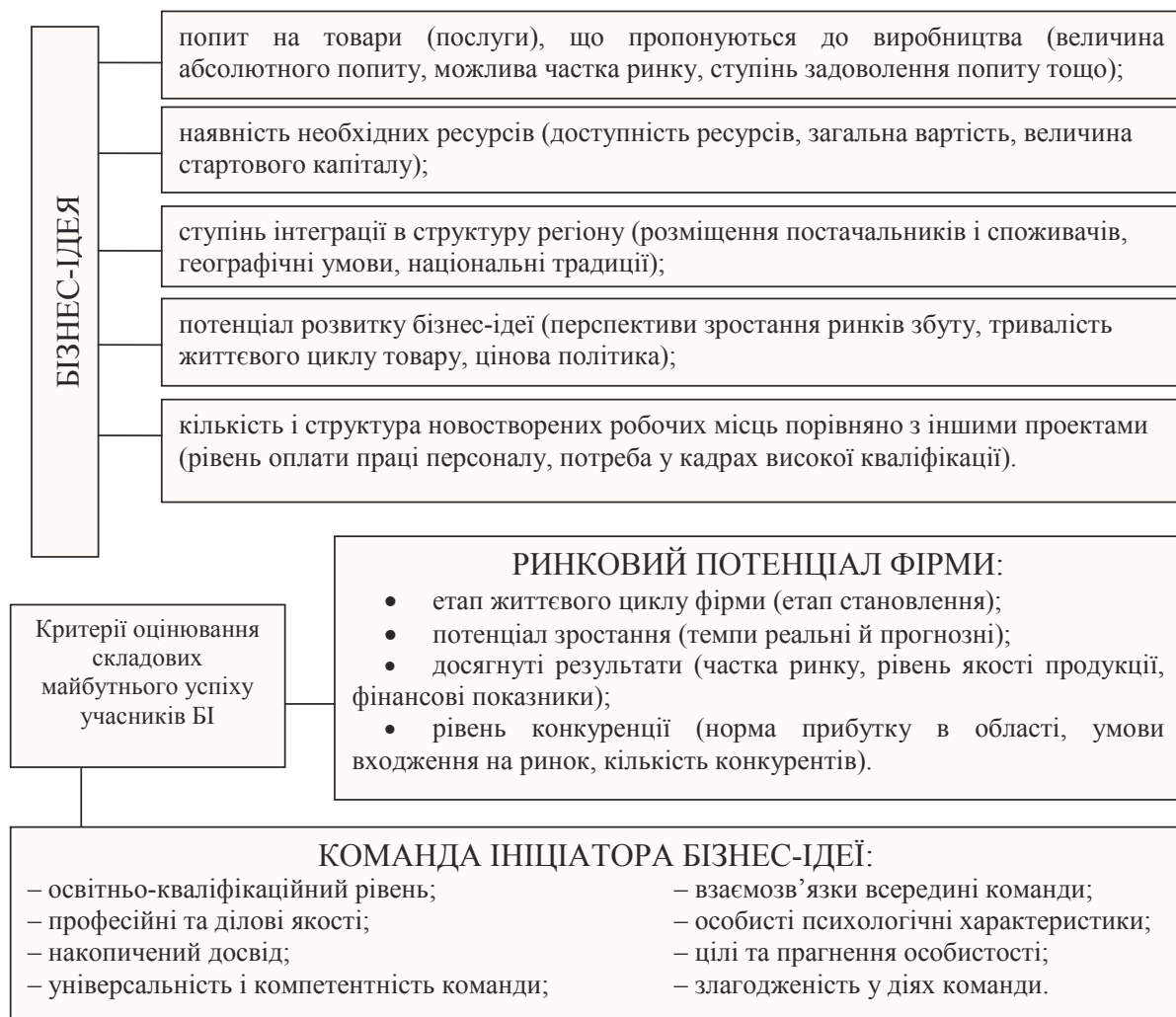
Рис. 1. Складові майбутнього успіху учасників Бі та критерії їх оцінки

Створюючи Бі, важливо виважено підбирати його учасників, правильно оцінюючи складові їх майбутнього успіху: бізнес-ідеї, команди і ринкового потенціалу фірми (рис. 1).