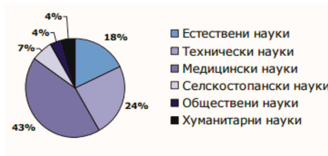
Рис. 2. Структура витрат на НДДКР у Болгарії за науковими напрямками, 2013 р.