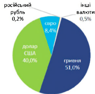
Рис. 3. Структура депозитів фізичних осіб за строками та валютами [1]

Проаналізувавши обсяги та динаміку депозитних вкладень в банках України, їх структуру в розрізі секторів економіки, строків та валют, звернемося безпосередньо до аналізу ефективності їх розміщення.