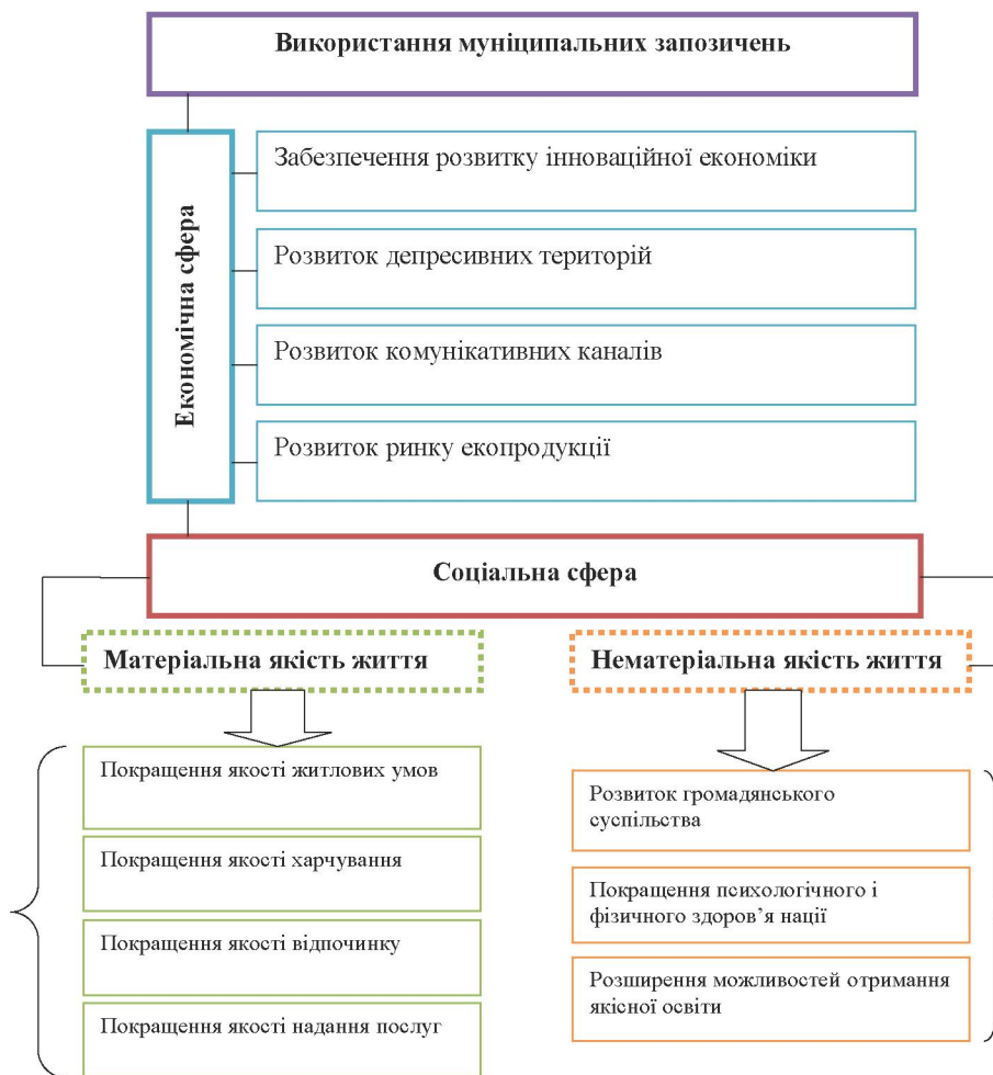
Рис. 1. Прояв ефективного використання муніципальних запозичень

Виклад основного матеріалу. Основною метою випуску муніципальних облігацій є акумулювання коштів для забезпечення економічного розвитку регіону та як результат – покращення матеріальної та нематеріальної якості життя громадян (рис. 1).