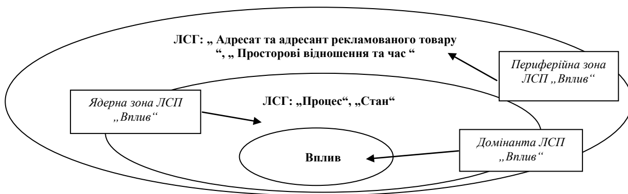
Рис. 2 Модель лексико-семантичного поля „Вплив“

Нами було встановлено, що використання перекладацьких стратегій на лексико-семантичному рівні функціонування системи мови спрямоване на збереження прагматичної спрямованості тексту оригіналу (далі ТО) під час трансляції.