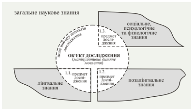
Рис. 1. Модель членування структури об'єкта комплексного лінгвістичного міждисциплінарного дослідження дитячого маніпулятивного мовлення

За означених умов, скористувавшись відомим методологічним образом [8, с. 85], ми отримуємо подану на рис. 1 модель членування об'єкта нашого дослідження.