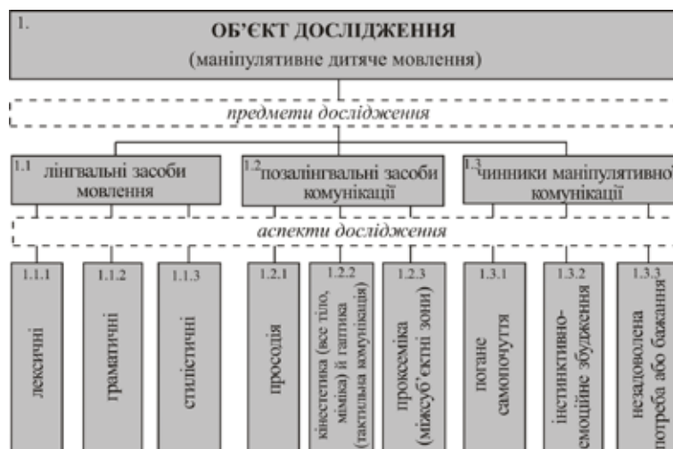
Рис. 2. Схема об'єкт-предметної структури дослідження когнітивних закономірностей просодичної організації дитячого маніпулятивного мовлення

До складу другого предмета (позалінгвальні засоби комунікації), як видно з рис. 2, входять просодичний, кінестетичний і проксемічний аспекти.