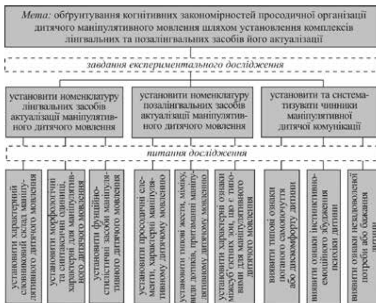
Рис. 3. Схема цільової структури дослідження когнітивних закономірностей просодичної організації дитячого маніпулятивного мовлення

Сформувавши таким чином об'єкт-предметну структуру, ми з достатнім ступенем методологічної надійності спроектували й відповідну їй цільову структуру нашого дослідження, наведену на рис. 3.