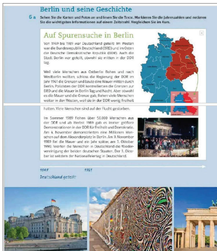
Foto 1. Berlin und seine Geschichte. Zuordnungsübung