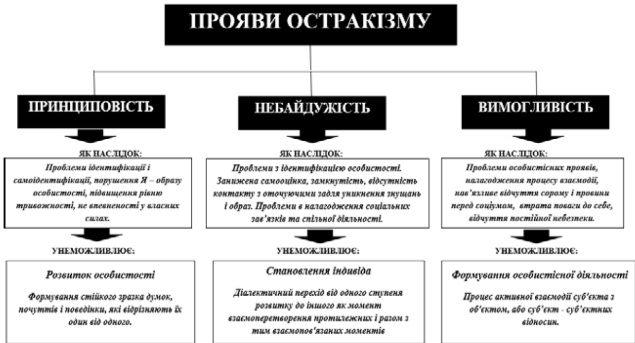
Рис. 2. Вплив остракізму на процес соціалізації індивіда в контексті освітнянського простору

Г. Лебон, розглядаючи психологічну ієрархію соціальних статусів, указував на те, що соціальне неприйняття починає проявлятися в дитячих закладах дошкільної освіти, коли відбувається розподіл на групи, що несвідомо запускає механізми «конкуренції» як у між групових, так і внутрішньогрупових відносинах, породжує зацікавленість у перебуванні в цьому процесі та небайдужість до його проявів, що слугує причиною проявів агресивної поведінки окремих індивідів [13].