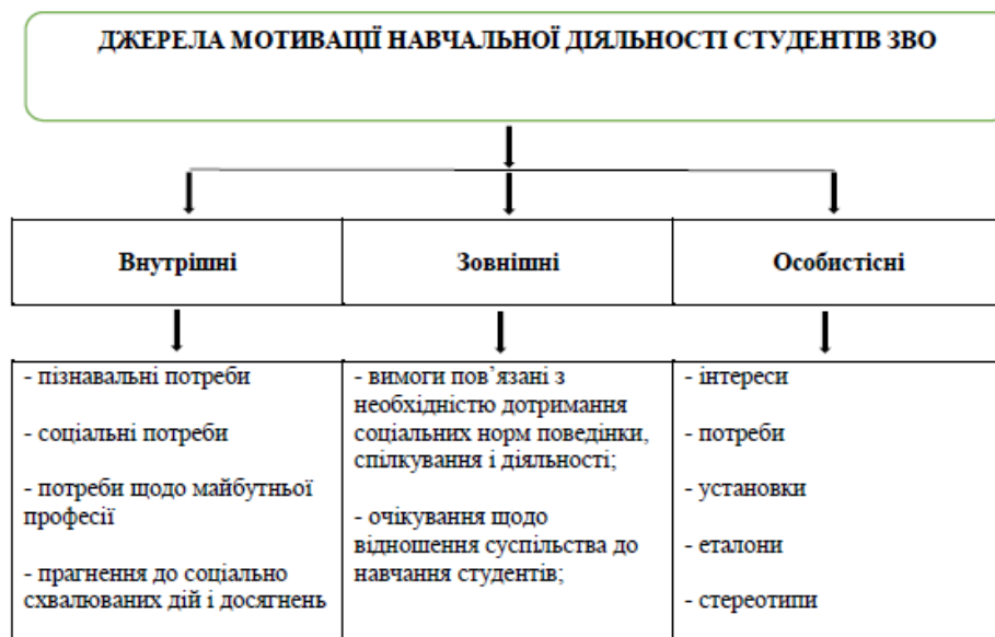
Рис. 1. Джерела мотивації навчальної діяльності студентів ЗВО

У науці виділено три основних джерела активності студентської навчальної діяльності: внутрішні, зовнішні та особистісні. Зрозуміло, що основні внутрішні джерела – соціальні і пізнавальні потреби студентської молоді у соціокультурному середовищі, а також їхні професійні прагнення, які вимагають соціального схвалення і затвердження. Зовнішні умови середовища, у якому функціонують студенти, а саме: соціальні норми цього суспільства, що стосуються поведінки, дотримання соціальних норм суспільства, спілкування тощо визначають зовнішні джерела мотивації. Навчальну діяльність студентів сприймаємо як необхідну передумову і норму суспільної поведінки, від дотримання якої залежить успішність навчальної та майбутньої професійної діяльності [13].