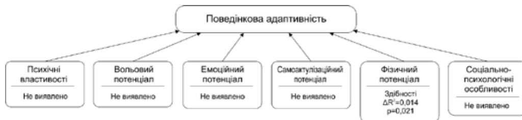
Рис. 2. Чинники детермінації поведінкової адаптивності, виділені в окремих блоках ієрархічно-паритетної структури

Зокрема, наявність особистісних здібностей передбачає досягнення успіху в певній сфері діяльності та, як наслідок, впливає на формування поведінкової адаптивності задля здобуття професійного розвитку і соціального визнання.