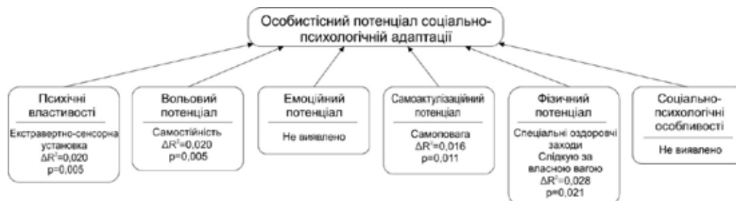
Рис. 3. Чинники детермінації особистісного потенціалу соціально-психологічної адаптації, виділені в окремих блоках ієрархічно-паритетної структури

Ці показники складають симбіоз адаптаційних задатків та здібностей особистості (рис.3).