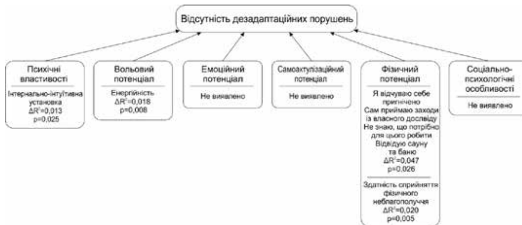
Рис. 4. Чинники детермінації відсутності дезадапційних порушень, виділені в окремих блоках ієрархічно-паритетної структури

то створює перешкоди на шляху до успішної адаптації. Це відбувається під час фізіологічного та нервового виснаження та виникнення симптомів псевдоадаптивної поведінки. Результати наведені на рис. 4.