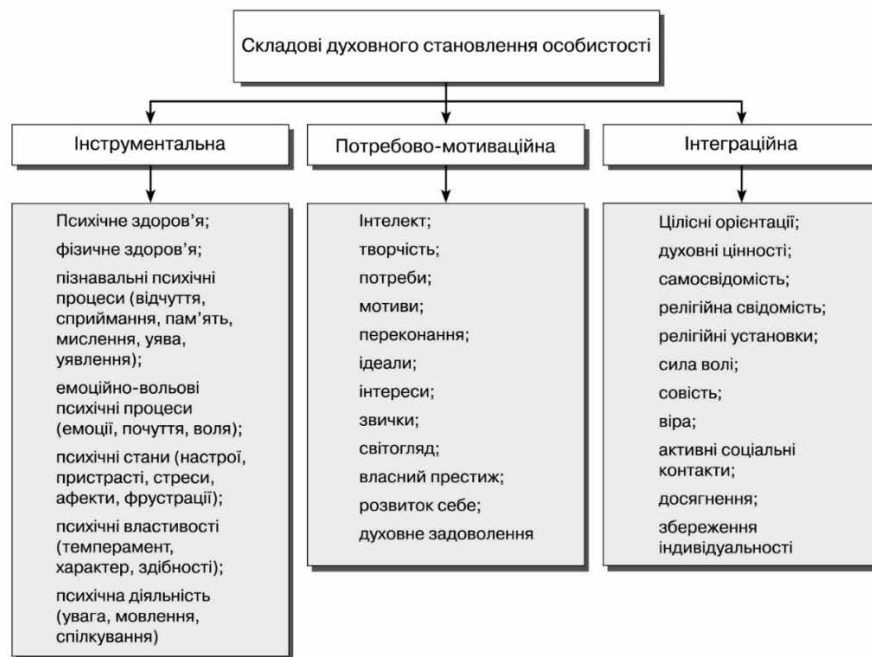
Рис. 2. Авторська модель інформаційного духовного становлення особистості

Авторська модель інформаційного духовного становлення особистості містить у собі інструментальний, потребово-мотиваційний та інтеграційний складники (рис. 2).