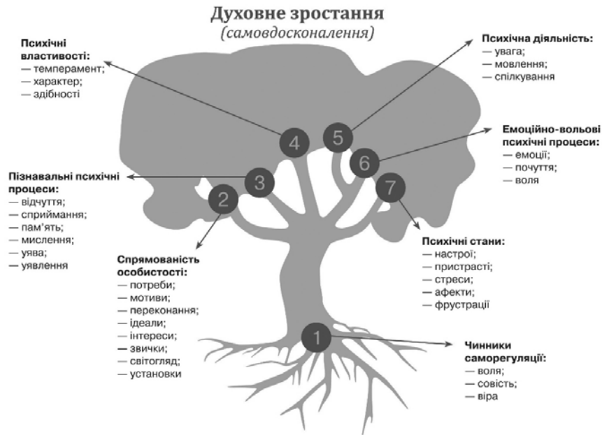
Рис. 1. Психологічна структура особистості за С. Максименко, Н. Жигайло

Авторська модель інформаційного духовного становлення особистості містить у собі інструментальний, потребово-мотиваційний та інтеграційний складники (рис. 2).