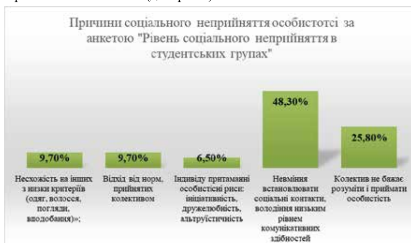
Рис. 6. Результати діагностики досліджуваних за анкету «Рівень соціального неприйняття в студентських групах». Питання: «На Вашу думку, людина – вигнанець, тому що...»

Також було виявлено, що 9,7% опитаних студентів (16 осіб) визначають основною причиною остракізації індивідів в освітньому середовищі «несхожість на інших з низки критеріїв (одяг, волосся, погляди, уподобання)»; 9,7% (16 осіб) указують на відхід від норм колективу як основну причину неприйняття. «Індивіду притаманні особистісні риси: ініціативність, дружелюбність, альтруїстичність» – таку причину визначають 6,5% опитаних (10 осіб); 48,3% (78 осіб) вважають основним чинником соціальної ізоляції індивіда невміння встановлювати соціальні контакти, володіння низьким рівнем комунікативних здібностей. 25,8% (42 особи) на питання «Людина – вигнанець, тому що...» обирають: «колектив не бажає розуміти і приймати особистість» (див. рис.6).