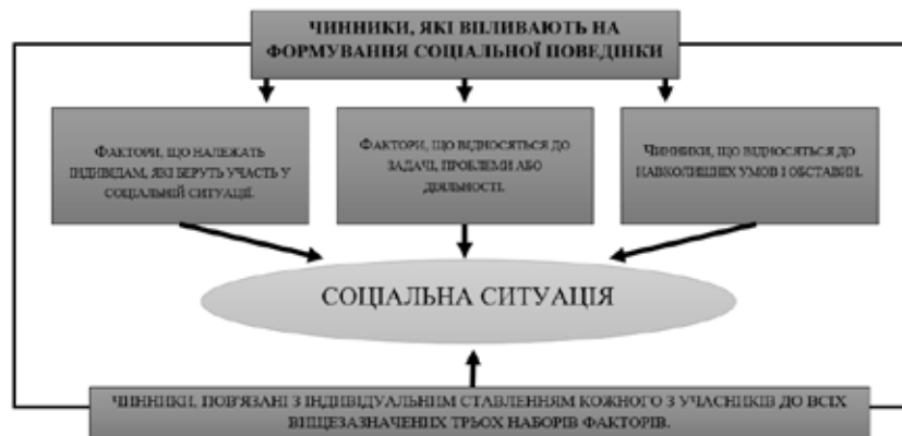
Рис. 2. Класифікація чинників, які впливають на формування соціальної ситуації.

4. Набір чинників, пов'язаних з індивідуальним ставленням кожного з учасників до всіх зазначених вище наборів чинників [4]. Вони містять навички щодо певного завдання або проблеми, ступінь тривалості залученості індивіда в проблему, його установки щодо інших учасників, його почуття легкості або дискомфорту щодо ситуації.