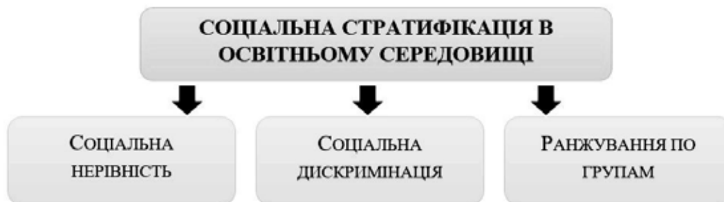
Рис. 4. Види соціальної диференціації в освітніх закладах

Під час вивчення причин соціальної ізоляції в освітньому середовищі важливим моментом є поняття стратифікації. Соціальна стратифікація позначає розшарування суспільства, відмінності в соціальному становищі його членів. Це явище характеризує систему соціальної нерівності, що складається з ієрархічно розташованих соціальних верств. Усі особи, що входять до конкретної страти, посідають приблизно однакове становище й мають спільні статусні ознаки [6] (див. рис. 4.).