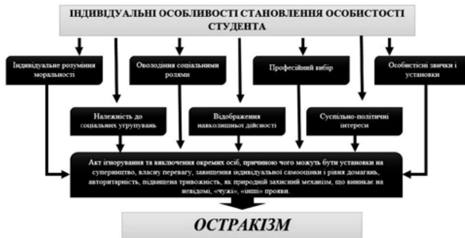
Рис. 3. Індивідуальні особливості студента як причини остракізації особистості

Головним соціальне завдання студентського віку – професійний вибір і професійне становлення. Спеціальна освіта – наступний етап щодо загальної освіти. Професійний вибір і вибір спеціального навчального закладу призводить до збільшення діапазону суспільно-політичних інтересів і ступеня відповідальності [1].