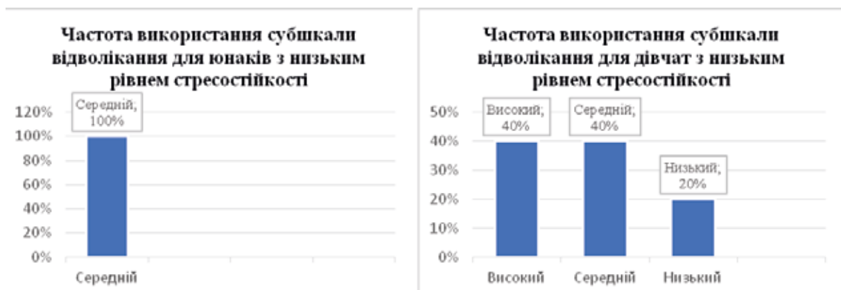
Рис. 4. Відмінності у виборі копіngu відвертання в гендерному вимірі в досліджуваних із низьким рівнем опірності стресу

Як видно з рисунка 3, 100% юнаків та 60% дівчат із низьким рівнем стресостійкості рідко застосовують копінг, орієнтований на уникнення. Водночас 40% дівчат його використовують часто та з середньою частотою. Наприклад, замість вирішення проблеми роблять покупки, споживають улюблену їжу, читають книги та інше.