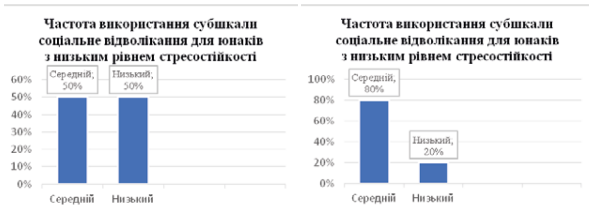
Рис. 5. Відмінності у виборі копіngu соціального відвертання в гендерному вимірі в досліджуваних із низьким рівнем опірності стресу

Як видно з рисунка 4, 40% дівчат із низьким рівнем стресостійкості мають високий показник та 40% – середній за субшкалою «Відвертання». Стресові ситуації вони переживають, відвертаючись від них на інші справи, як-от, перегляд улюблених фільмів, прогулянки, час наодинці. Середній показник мають 100% хлопців. І лише 20% студенток дуже рідко застосовують цю копінг-стратегію.