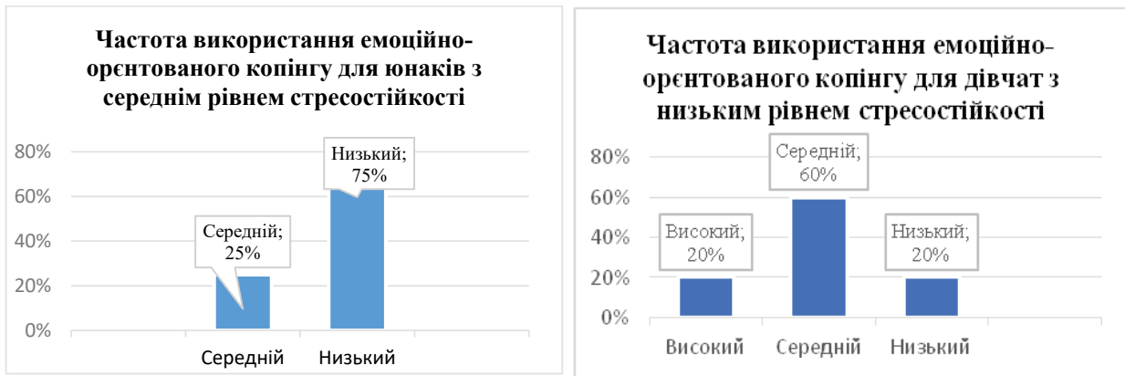
Рис. 2. Відмінності у виборі емоційно-орієнтованого копіngu (ЕОК) у гендерному вимірі в досліджуваних із низьким рівнем опірності стресу

Як видно з рисунка 2, 100% юнаків та 60% дівчат із низьким рівнем стресостійкості демонструють середню частоту використання емоційно-орієнтованого копіngu, а 20% дівчат часто його використовують. Ця група осіб відчуває значне емоційне напруження під час стресової ситуації, досить часто буває зовнішня та внутрішня агресія.