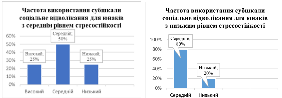
Рис. 10. Відмінності у виборі копінгу соціального відвертання в гендерному вимірі в досліджуваних із середнім рівнем опірності стресу

Результати використання копінгу соціального відвертання в підгрупі респондентів із середнім рівнем опірності стресу подано на рисунку 10.