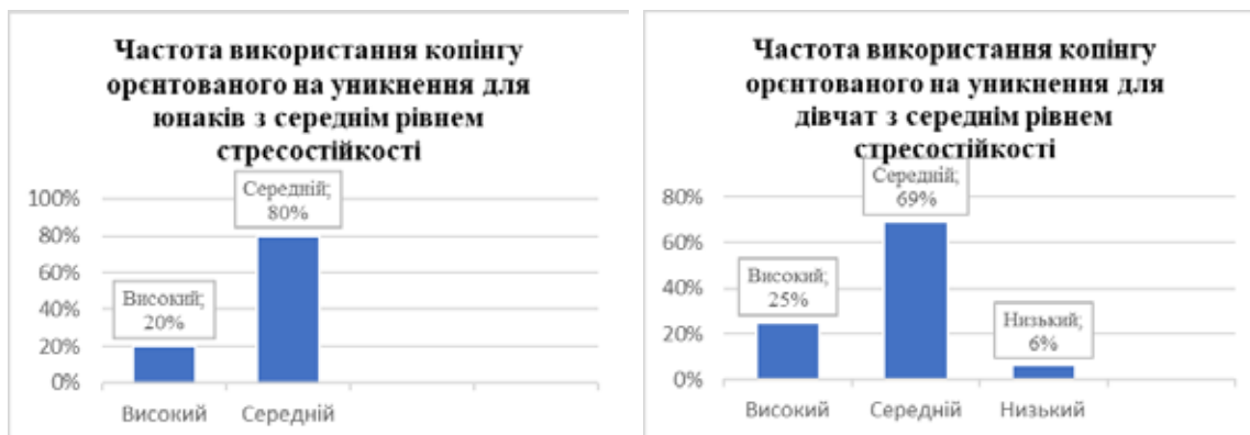
Рис. 8. Відмінності у виборі копіngu, орієнтованого на уникнення, у гендерному вимірі в досліджуваних із середнім рівнем опірності стресу

Результати використання копіngu, орієнтованого на уникнення, у підгрупі респондентів із середнім рівнем опірності стресу подано на рисунку 8.