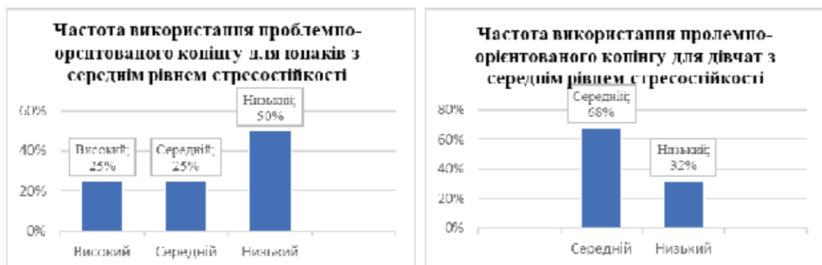
Рис. 6. Відмінності у виборі проблемно-орієнтованого копіngu (ПОК) у гендерному вимірі в досліджуваних із середнім рівнем опірності стресу

Результати використання проблемно-орієнтованого копіngu в підгрупі респондентів із середнім рівнем опірності стресу подано на рисунку 6.