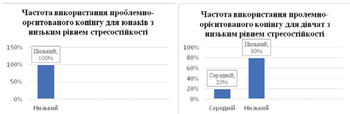
Рис. 1. Відмінності у виборі проблемно-орієнтованого копіngu (ПОК) у гендерному вимірі в досліджуваних із низьким рівнем опірності стресу

Установлено, що з-поміж юнаків із низьким рівнем опірності стресу переважає стратегія емоційно-орієнтованого копіngu (100% – середня частота використання), так само з-поміж дівчат (60% – середня частота та 20% – висока частота використання). На відміну від юнаків, 40% дівчат частіше використовують стратегію уникнення (по 20% середня та висока частота використання).