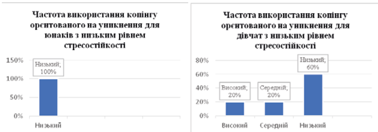
Рис. 3. Відмінності у виборі копіngu, орієнтованого на уникнення, у гендерному вимірі в досліджуваних із низьким рівнем опірності стресу

Як видно з рисунка 2, 100% юнаків та 60% дівчат із низьким рівнем стресостійкості демонструють середню частоту використання емоційно-орієнтованого копіngu, а 20% дівчат часто його використовують. Ця група осіб відчуває значне емоційне напруження під час стресової ситуації, досить часто буває зовнішня та внутрішня агресія.