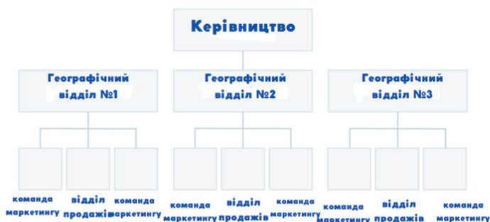
Рис. 3. Ринкова структура [Devaney Erik, 2022].

Ще одним різновидом організаційної структури є ринкова структура (див. рис. 3), в якій підрозділи організації базуються на напрямках діяльності або типах клієнтів.