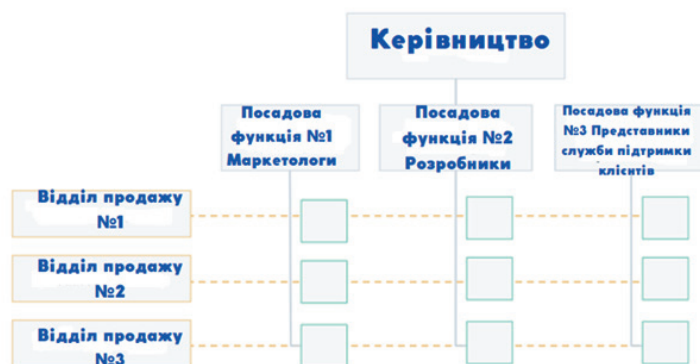
Рис. 6. Матрична структура [Devaney Erik, 2022].

На відміну від інших структур, матрична організаційна структура (див. рис. 6) не відповідає традиційній ієрархічній моделі. Натомість усі працівники мають подвійні відносини підзвітності перед керівництвом. Як правило, існує функційна лінія звітності (зображена синім кольором), а також лінія звітності на основі виконаних завдань (зображена червоним кольором).