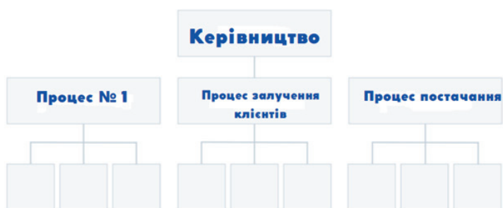
Рис. 5. Процесно орієнтована структура [Devaney Erik, 2022].

Організаційну структуру на основі процесів (рис. 5) розробляють навколо наскрізного потоку різних видів діяльності, таких як «дослідження та розробка», «залучення клієнтів» та «виконання замовлень». На відміну від суто функційної структури, процесно орієнтована структура враховує не тільки діяльність, яку виконують співробітники, але й те, як ці різні види діяльності взаємодіють одна з одною.