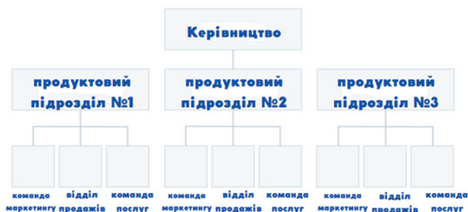
Рис. 2. Структура підрозділу на основі виду діяльності [Devaney Erik, 2022].

Надзвичайно важливою є структура підрозділу на основі виду діяльності (див. рис. 2), яка складається з кількох функційних структур, тобто кожен підрозділ у структурі може мати власну команду маркетингу, власну команду продажів тощо.