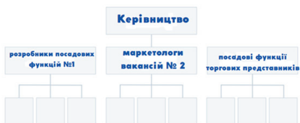
Рис. 1. Функційна організаційна структура [Devaney Erik, 2022].

Варто відзначити функційну організаційну структуру (див. рис. 1), одну з найпоширеніших серед видів структур, що застосовують у діяльності організації. Основною перевагою є поділ організації на відділи на основі спільних робочих функцій та завдань. Підприємство, яке у своїй діяльності використовує функційну організаційну структуру, об'єднує всіх маркетологів в одному відділі, економістів в іншому відділі тощо [Devaney Erik, 2022].